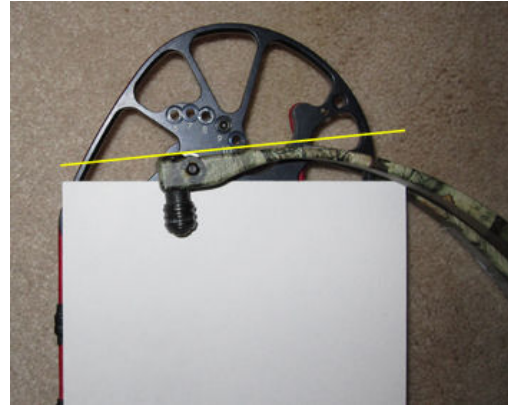
オーバー・パラレルリム